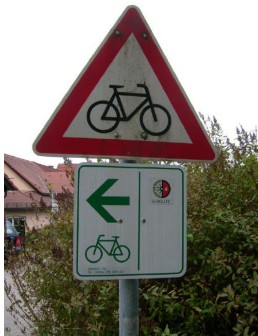
Ausschilderung am Lochmühlenweg Jagdschloss Graupa

Die Route ist ab Dresden bis Zittau komplett beschildert und verbindet den Elberadweg mit dem Spree- und dem Oder-Neiße-Radweg.