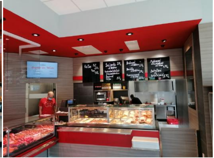
Dürrröhrsdorfer Fleisch- und Wurstwaren